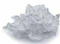
EF 127 Schilferijs Restwatergehalte 25%