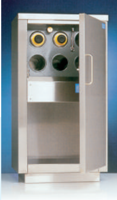
Kruikenmoeder met opbergruimte

De kruikenmoeders van Dörr zijn vanzelfsprekend solide en uiterst veilig. De binnenketel is gemaakt van roodkoper, terwijl de buitenbeplating geheel uit roestvrijstaal bestaat.