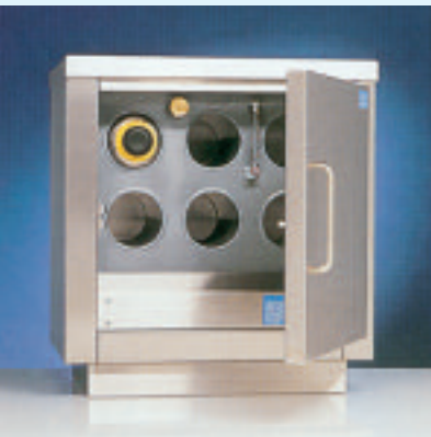
Kruikenmoeder zonder opbergruimte

De verwarming geschiedt door een elektrisch domp-element, de temperatuur wordt thermostatisch geregeld. Standaard voorzien van een droogkookbeveiliging. Op het front van de binnenketel is een peilglas aangebracht waarop het waterniveau is af te lezen. Bijvullen geschiedt door een vulopening op het ketelfront. Kruikenmoeders zijn leverbaar in vrijstaande-, hangende-of inbouwuitvoering.